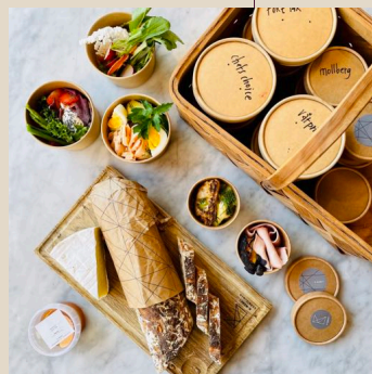
PICKNICK Maten kan levereras som picknick i stängda pappbägare. Komplettera med baguette, "brieost", marmelad, oliver & nötter för riktig picknick-feeling. Pris: 95:-/ person