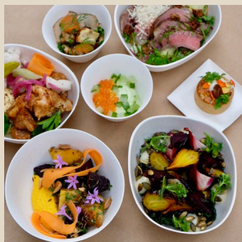
EXEMPEL 4st Tilltugg Större och 3st Tilltugg Liten