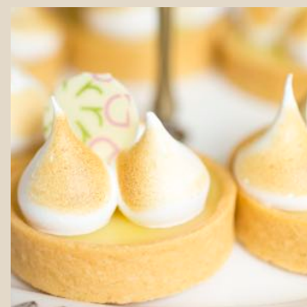
Passionstartlette med italiensk maräng

Chef's Choice betyder att vi skapar menyn samma dag. Vad som serveras varierar med andra ord. Genom att låta kockarna välja råvaror beroende på säsong och tillgänglighet kan vi använda de resurser som finns. Med andra ord - hållbar mat.