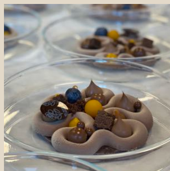
EXEMPEL Dessert i glastallrik